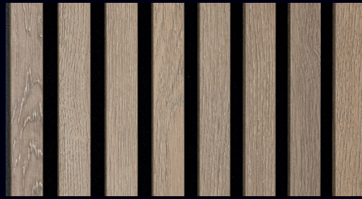
Eiche multicolor 7033 / Holznachbildung