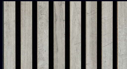
Gravel Stone 7035 / Holznachbildung