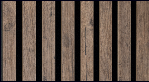
Altholzeiche 7032 / Holznachbildung