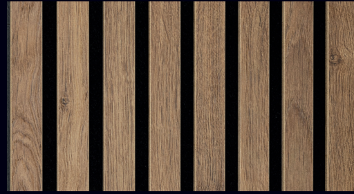
Eiche terrabraun 7031 / Holznachbildung