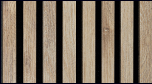
Eiche hell 7030 / Holznachbildung